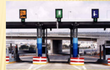
Combined manual and Electronic tolling