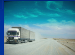
Truck and trailer travelling along CAREC route in Kazakhstan to Uzbekistan on gravel road; September 2011