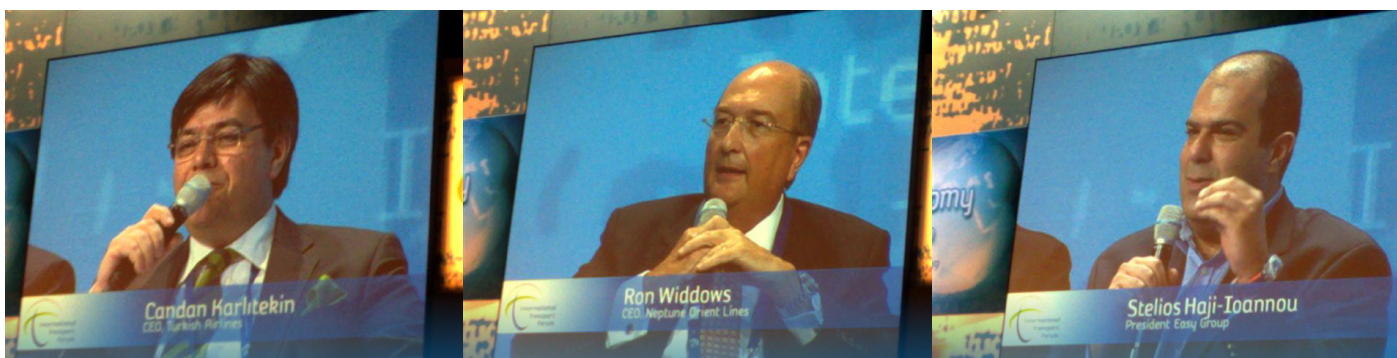
Candan Karlitekin CEO-Companiile aeriene din Turcia

Pentru a menține piețele libere și pentru a evita protecționismul este nevoie de dereglementare, de reducere a controlului guvernelor asupra piețelor, care va servi drept stimul permanent pentru economie. Piețele de transport trebuie să fie deschise cooperării internaționale, cu oportunități pentru toate modurile de transport și