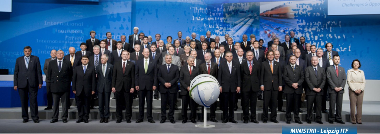
MINISTRIL - Leipzig ITF

Forumul este o platformă inter-guvernamentală globală care a reunit 52 de Miniștri și 800 de delegați din toată lumea, reprezentanți din guverne, din industrie precum și din comunitatea științifică iar anul acesta s-a desfășurat în Leipzig, Germania în perioada 26-29 Mai și a avut drept temă “Transport pentru o Economie Globală: Noi Provocări și Oportunități” .