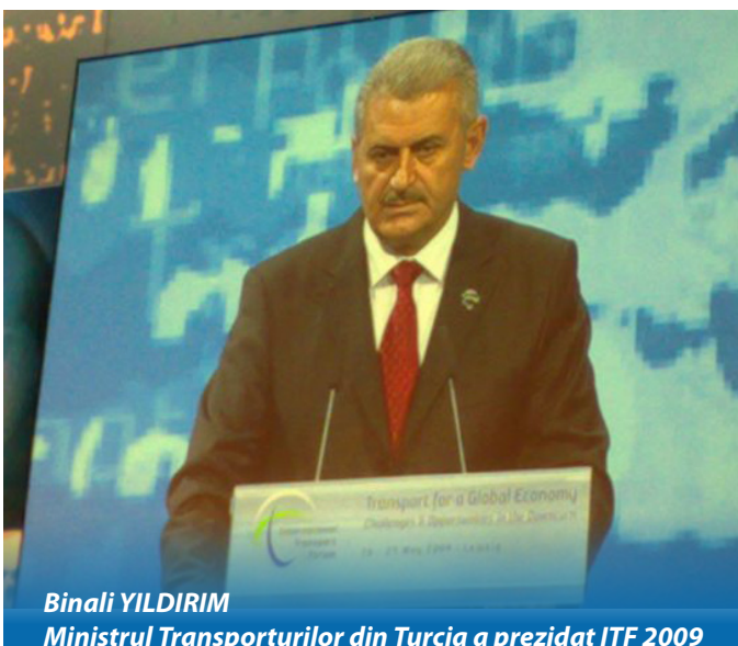
Binali YILDIRIM Ministrul Transporturilor din Turcia a prezidat ITF 2009

Discuțiile din cadrul forumului și-au propus să răspundă la întrebări esențiale pentru economie și pentru transporturi: Ce reprezintă criza economică actuală pentru globalizare?; Transportul și globalizarea – Cine va câștiga și cine va pierde?; Cum va afecta criza imobiliară globală programele de investiții din transport?; Costuri mari de transport – Ce impact vor avea pentru o economie globală?; Transportul este un generator de globalizare sau este mai degrabă indus de aceasta?