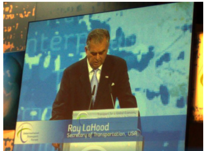
Ray LaHood Secretarul de stat al transporturilor, USA

Guvernele pot promova și un transport durabil cu emisii scăzute de carbon, eficient din punct de vedere cost care să satisfacă nevoile cetățenilor, companiilor și comunității globale și care în același timp va face față provocărilor viitorului pentru că redresarea economică în sectorul transporturilor trebuie să fie în armonie cu mediul înconjurător.