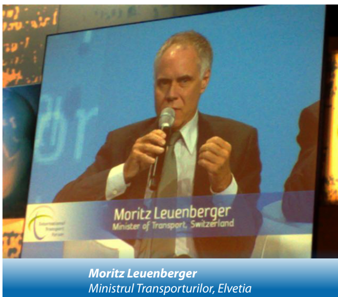
Moritz Leuenberger Ministrul Transporturilor, Elvetia

Liderii G20 susțin sprijinirea comerțului și transportului rutier, iar guvernele trebuie să implementeze Anexa 8 a Convenției Internaționale a ONU privind Armonizarea Frontierelor și Controlul Vamal al Bunurilor.