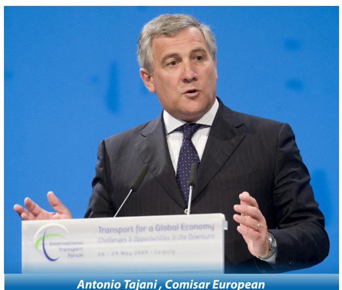
Antonio Tajani , Comisar European