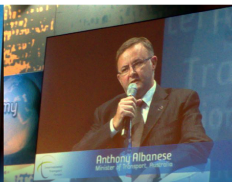
Anthony Albanese Ministrul transporturilor Austria