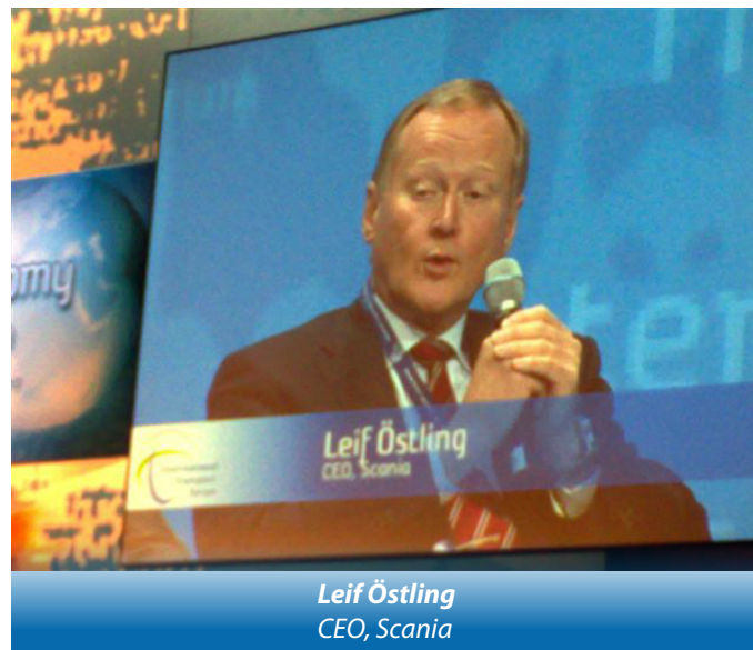
Leif Östling CEO, Scania

Între măsurile necesare sprijinirii transportului rutier sunt: introducerea de stimulente pentru companii pentru vehicule sigure și curate, modificarea legislației insolvenței pentru