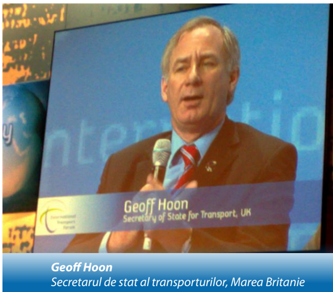
Geoff Hoon Secretarul de stat al transporturilor, Marea Britanie

Concluziile de la Conferința ONU privind schimbările climatice COP 15 din Copenhaga și din alte organizații precum IMO și ICAO trebuie să intensifice acțiunile pentru reducerea emisiilor din transport.