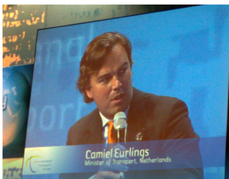
Camiel Eurlings Ministrul transporturilor Olanda